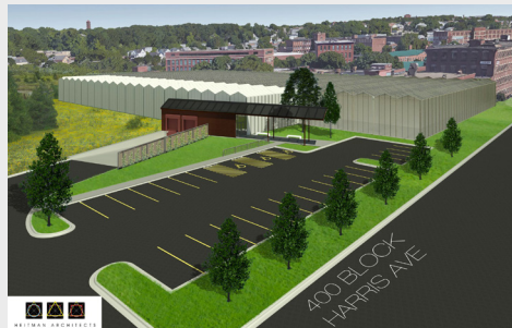
Representación de Gotham Greens 586 Atwells Avenue

Involúcrese Contacte a la ciudad y díganos que propiedades dentro del Corredor de Woonasquatucket le gustaría que fueran evaluadas y cuál es su visión y/o necesidades para estas propiedades. Descubra si su propiedad puede ser elegible para participar en este programa.