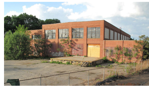
WaterFire Arts Center, 475 Valley Street – antes y después

Con más de 500 hectáreas de terreno el corredor de Woonasquatucket abarca partes de tres barrios de Providence: Olneyville, Valley y Smith Hill. El corredor de Woonasquatucket cuenta con una rica historia como centro industrial que data desde el siglo XIX. Sin embargo, muchos sitios que fueron una vez ocupados por gigantes industriales, se han quedado vacíos y abandonados. Más de un siglo de uso continuo de