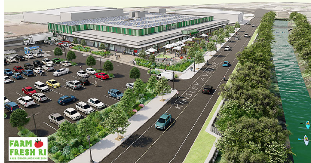
Representación del Centro de Alimentación de RI Farm Fresh RI, 498 Kinsley Avenue

MAYOR JORGE O. ELORZA CITY OF PROVIDENCE